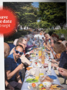
On Sunday afternoon, September 10th, the second 'long table lunch' will take place